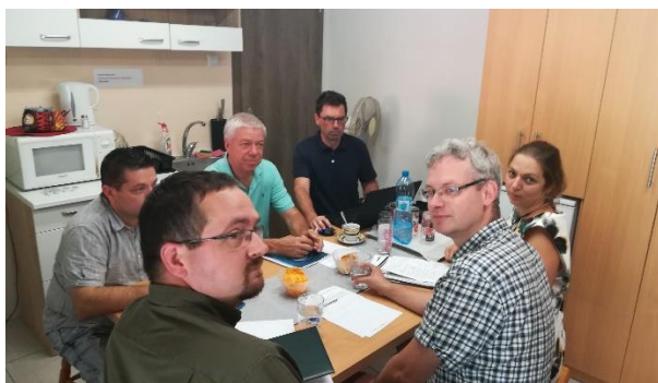
Staff meeting sa konal v Košiciach 28.8.2019